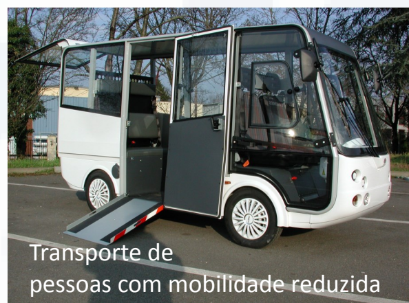
Transporte de pessoas com mobilidade reduzida

O Geco Shuttle ajusta-se ainda a outras funções bastante específicas e exigentes