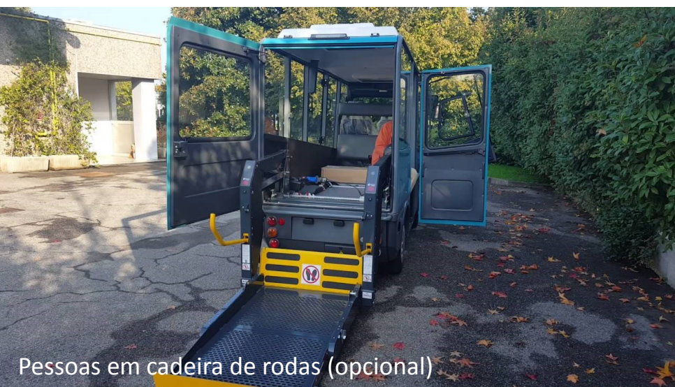
Pessoas em cadeira de rodas (opcional)