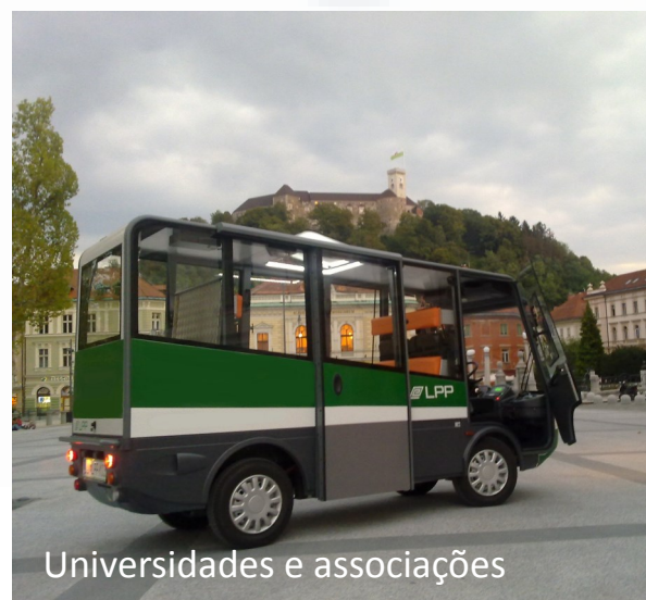
Universidades e associações