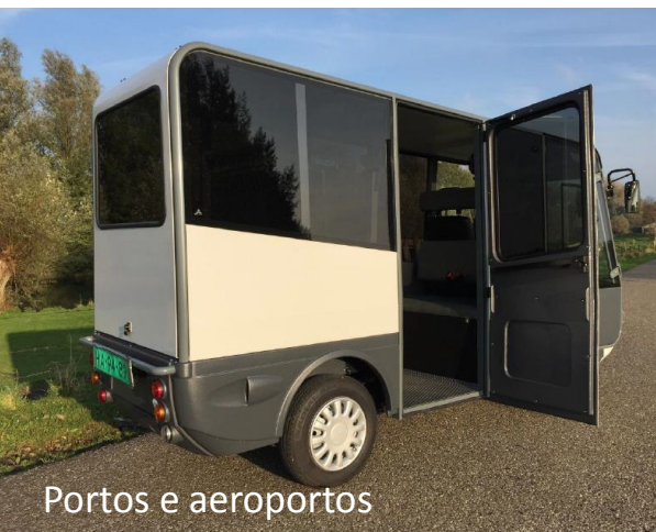
Portos e aeroportos